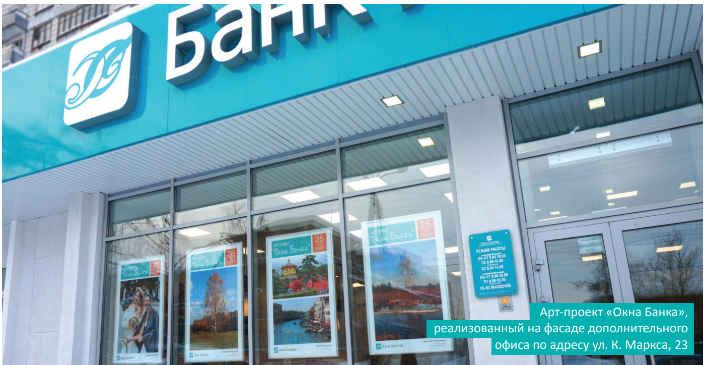
Арт-проект «Окна Банка», реализованный на фасаде дополнительного офиса по адресу ул. К. Маркса, 23